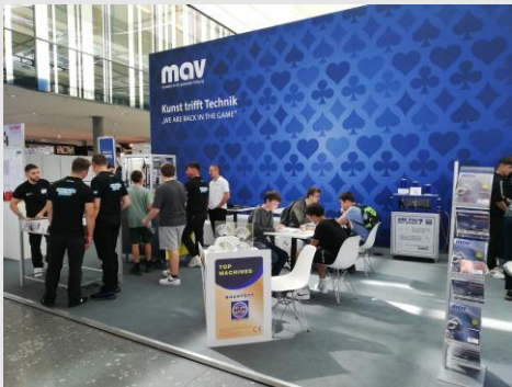
2022: AMB – We are back in the Game

Seit Jahren geschätzter und etablierter Bestandteil der AMB in Stuttgart