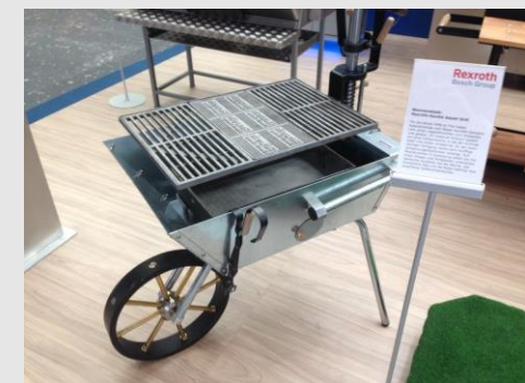
... 2014, 2012, 2010